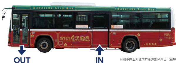
※图中巴士为城下町金泽观光巴士（右环线）。