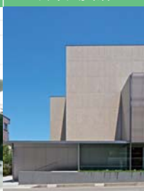
谷口吉郎·吉生金泽纪念建筑馆