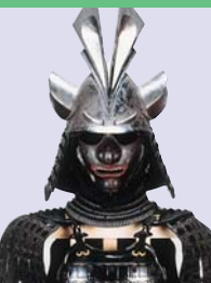
前田土佐守家資料館