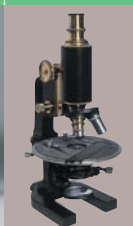
Musée des illustres figures de Kanazawa