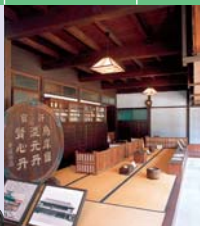
Musée Kanazawa Shinise Kinenkan