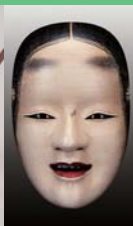
Musée du Nô de Kanazawa