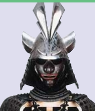
Musée Maeda Tosanokami-ke Shiryokan