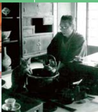
Musée Muro Saisei Kinenkan