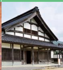
Kanazawa Yuwaku Edomura