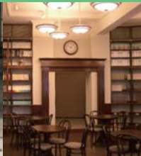
Centre de littérature de Kanazawa