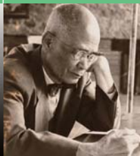
Musée D.T. Suzuki