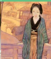
Musée Kanazawa Yuwaku Yumeji-kan