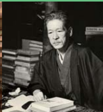
Musée Tokuda Shusei Kinenkan