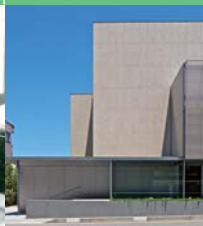
Musée d'architecture Yoshiro et Yoshio Taniguchi, Kanazawa