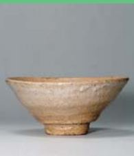
Musée mémorial Nakamura de Kanazawa