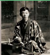
Musée Izumi Kyoka Kinenkan