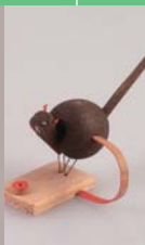
Musée folklorique de Kanazawa