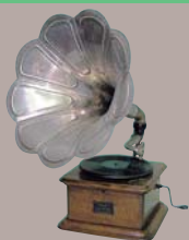
Musée du phonographe de Kanazawa