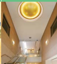
Musée Yasue de la feuille d'or de Kanazawa